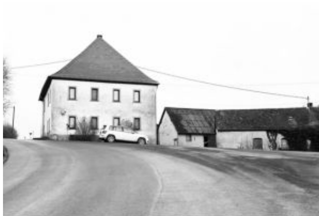
022 Eddie Bonesire