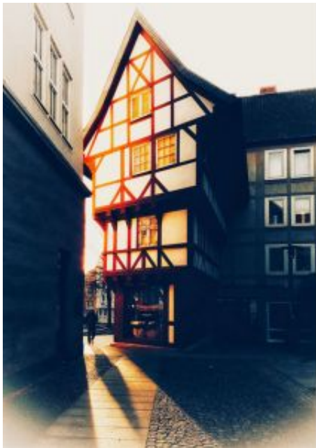
095 Voksma Schelle