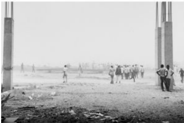
086 Mohammad Altoun